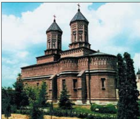
Biserica "Treierarhi" din Iasi, ctitorie a domnitorului Vasile Lupu

Să rugăm pe Sfinții Trei Ierarhi Vasile, Grigorie și Ioan, care sînt foarte cinstiți în țara noastră și au la lăși cea mai frumoasă biserică din Europa închinată lor, să se roage înaintea Preasfintei Treimi pentru întărirea dreptei credințe, pentru pacea și unitatea Sfintei Biserici și pentru mîntuirea sufletelor noastre. Amin."