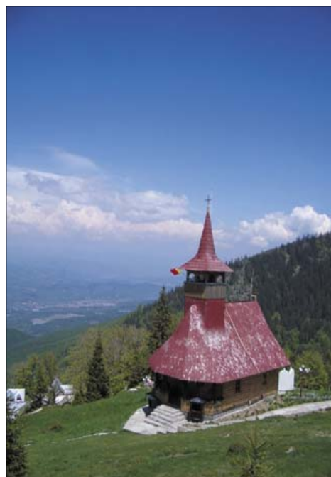
Schitul "Straja" ridicat pe coama vîrfului cu același nume, de către o mână de localnici ai Văii Jiului.

spune acum nepoților, cu un reînoit realism, căci tot ceea ce ele povestesc într-un grai arhaic, pastoral, este atât de asemănător cu realitatea pe care el o trăiește zi de zi. Și nu poate fi nimic neadevărat în aceste nestemate spirituale, atîta vreme cît, la acest ceas de secol 21, Baciul, la fel ca bunul lui și la fel ca vitejii lui strămoși, încă mai tunde oile, cosește fânul, pune brînză în putini, taie porcul în ajun și apoi moșește mieii, după care din nou tunde oile, și asta în timp ce își crește pruncii și mai ales, smerit, nu uită să îi mulțumească lui Dumnezeu.