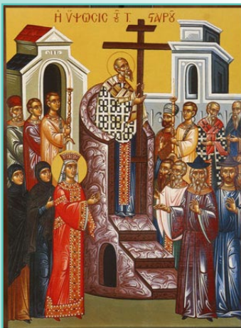
Înălțarea Sfintei Cruci

“De trei ori fericita și preacinstita Cruce, ție ne închinăm credincioșii și te mărim, veselindu-ne de dumnezeiasca ta înălțare; ci ca o pavază și armă nebiruită, ocrotește și acoperă cu darul tău, pe cei ce cântă: Bucură-te, Cinstita Cruce, păzitoare a creștinilor!”