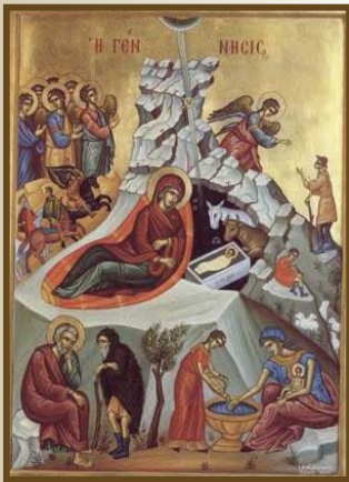
Nașterea Domnului și Mântuitorului nostru Iisus Hristos

Condacul Fecioara astăzi pe cel mai presus de ființă naște și pământul - peștera celui neapropiat aduce. Îngerii cu păstorii slavoslovesc și magii cu steaua călătoresc. Că pentru noi s-a născut Prunc tânăr, Dumnezeu cel mai înainte de veci.