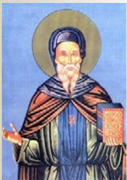
Sfântul Ioan Casian

Celor ce din neamul nostru s-au învrednicit a dobândi, prin nevointele și sângele lor, darul sfințeniei, fiind astfel slava neamului nostru înaintea lui Dumnezeu și a oamenilor, acestora și noi, ca unora ce pururea mijlocesc înaintea tronului lui Dumnezeu pentru mântuirea noastră, sa le strigam cu bucurie: Bucurati-va, sfinților toti, care ati stralucit pe pamântul tarii noastre!