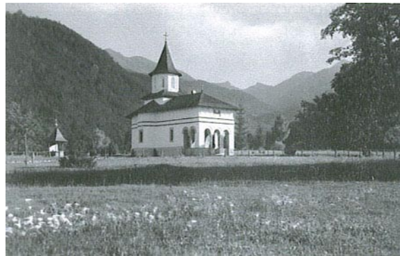
Biserica Mănăstirii de la Sâmbăta, ctitoria Voevodului Martir Constantin Brâncoveanu