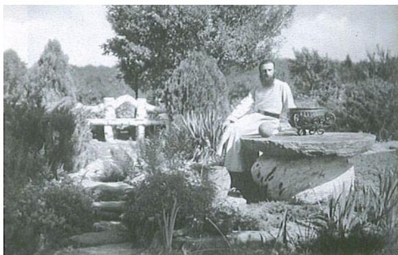
Părintele Arsenie în minunata grădină dimprejurul Mănăstirii de la Sâmbăta de Sus