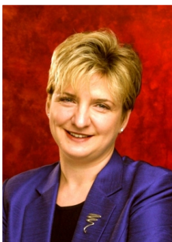
John L. Scott REAL ESTATE

Cumpărarea sau vânzarea unei proprietăți este una dintre cele mai importante decizii financiare pe care le luați în viață. NU O LĂSAȚI PE MÂNA ORICUI!