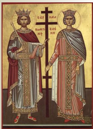
Sfinții Împărați Constantin și Elena (21 mai)

Constantin astăzi, cu maica sa Elena, Crucea au arătat lemnul cel preacinstit, care este rușinea iudeilor și arma credincioșilor asupra celui potrivnic; ca pentru noi s-a arătat semn mare și în războaie înfricoșător.