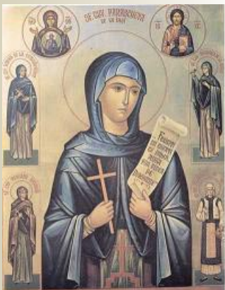
Sf Cuvioasă Parascheva (14 octombrie)

“Pe Sfânta, ajutătoarea celor ce sunt întru nevoi, toți cu bună credință să o laudăm, pe prea cinstita Parascheva. Că aceasta lăsând viața cea stricăcioasă, pe cea nestricăcioasă a luat în veci. Pentru aceasta mărire a aflat și dar de minuni, cu dumnezeiască poruncă.”