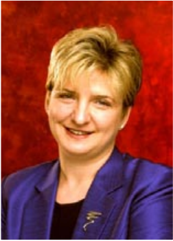
John L. Scott REAL ESTATE

Cumpărarea sau vânzarea unei proprietăți este una dintre cele mai importante decizii financiare pe care le luați în viață. NU O LĂSAȚI PE MÂNA ORICUI!