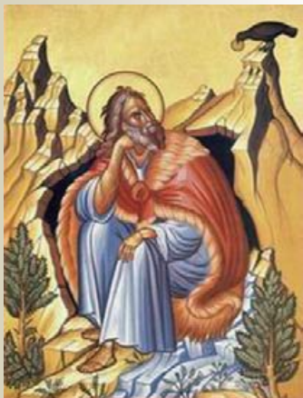
Sfântul Prooroc Ilie Tesviteanul (20 iulie)

Tu, cel ce ai fost alesul Domnului pentru întoarcerea lui Israel de la închinarea către Baal, aspru muștrător al împăraților nelegiuți, strălucind cu văpaia râvnei pentru Dumnezeu atotțiitorul, cu sfințenia vieții și a minunilor, cel ce te-ai ridicat cu trupul la ceruri și vei veni înaintea celei de a doua veniri a lui Hristos, laudă îți aducem ție, profetule al lui Dumnezeu Ilie.[...]