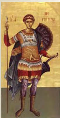
Sf. Mare Mucenic Dimitrie (26 octombrie)

“Invățătorului dreptslăvitoarei credințe celei întru Hristos, surpătorului și rușinatorului păgânătății, Izvorătorului de mir, Marelui Mucenic Dimitrie, ostașul cel adevărat al lui Hristos, care s-a arătat Bisericii ca un soare și mare apărător credincioșilor, toți acum cântări de mulțumire și laude din suflet cu dorire aducându-i să-i cântăm: bucură-te, Izvorătorule de mir, Mare Mucenice Dimitrie !”