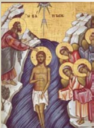
Botezul Domnului (6 ianuarie)

“Arătat-Te-ai astăzi lumii și lumina Ta, Doamne, s-a însemnat peste noi, care cu cunoștință Te laudăm. Venit-ai și Te-ai arătat, Lumina cea neapropiată.”