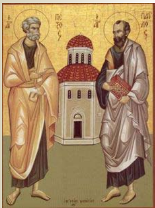
Sfinții Apostoli Petru și Pavel (29 iunie)

Pe cei ce împreună cu oamenii s-au arătat mai înainte îngerește cugetând, și acum cu îngerii fiind, cu cântări îngerești și lui Dumnezeu cuvioase, să laudăm pe întâi stătătorii Apostolilor, ca pe cei ce sunt izbăvitorii sufletelor noastre, strigând: Bucurați-vă Petru și Pavele, Apostolilor!