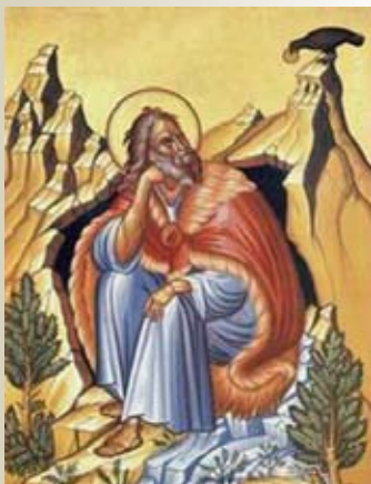
Sf. Prooroc Ilie Tesviteanul (20 iulie)

Tu, cel ce ai fost alesul Domnului pentru întoarcerea lui Israel de la închinarea către Baal, aspru muștrător al împăraților nelegiuți, strălucind cu văpaia râvniei pentru Dumnezeu atotțiitorul, cu sfințenia vieții și a minunilor, cel ce te-ai ridicat cu trupul la ceruri și vei veni înaintea celei de a doua veniri a lui Hristos, laudă îți aducem ție, profetule al lui Dumnezeu Ilie.[...]