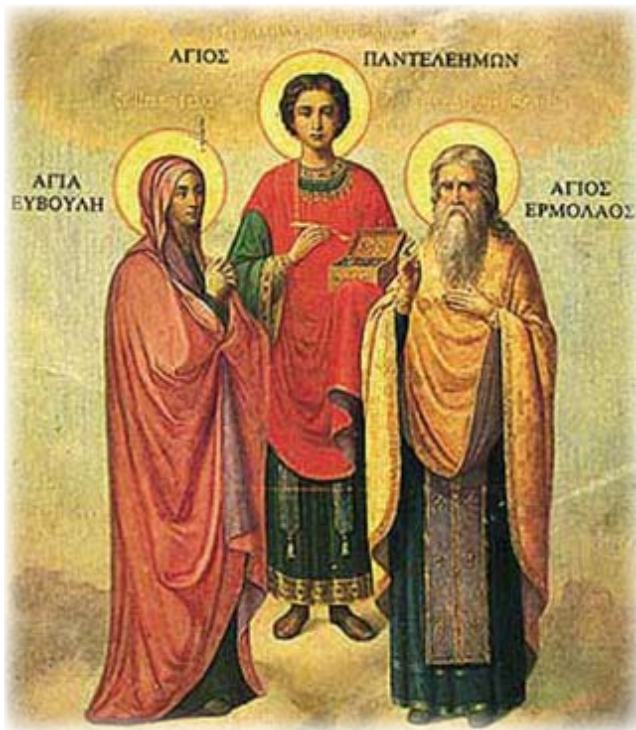
Sf Evula, Sf Pantelimon și Sf Ermolae

Cum Maximian il intreba de unde avea o asemenea putere si cum ajunsese el la Credinta Crestina, Pantoleon ii arata unde se ascundea Ermolae, caci Dumnezeu ii facuse cunoscut ca venise vremea, pentru el si stapânul sau, sa-L marturiseasca si sa isi gaseasca in Mucenicie desavârsirea. Dupa moartea preamarita a Sfântului Ermolae si a celor impreuna cu el, tiranul il aduse din nou pe Pantoleon si pretinzând ca mucenicii se supusera,