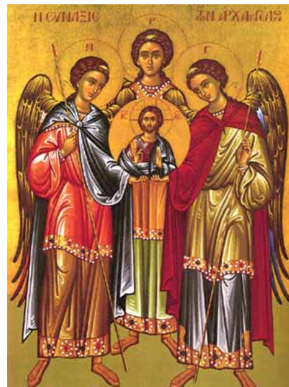
Sf Arhangheli Mihail, Gavriil și Rafail

Gomorei. I s-a arătat lui Iacov când fugea de mânia fratelui său Isav și a vrăjitorului Valam, care voia să blesteme poporul Israel. Tot el este cel care a venit și l-a întărit pe Iosua, fiul lui Navi, înainte de începerea cuceririi Canaanului. Cât despre Sfântul Arhanghel Gavriil, acesta este binevestitorul Nașterii Domnului și al celui mai important prooroc: Sfântul Ioan Botezătorul. El i-a tâlcuit proorocului Daniel viziunile. Tot Sfântul Arhanghel Gavriil a vestit nașterea Fecioarei Maria. El a hrănit-o pe Preasfânta Născătoare de Dumnezeu în Sfânta Sfintelor. În Minei se precizează că