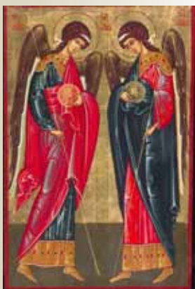
Sfinții Arhangheli Mihail și Gavriil (14 noiembrie)

“Pe căpeteniile îngerilor Treimii, pe Mihail și Gavriil, să-i laudăm noi toți, iubitorii de praznic, care ne acoperim cu aripile amândorura și din nevoile cele de multe feluri ne izbăvim; unuia grăind: Bucură-te slujitorule al Legii, iar altuia zicând: Bucură-te, îngere al darului!”