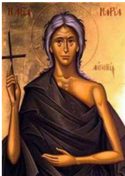
Sf. Maria Egipteanca