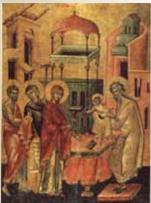
Întâmpinarea Domnului (2 februarie)

“Cel ce ai sfințit pântecul Fecioarei cu nașterea Ta și mâinile lui Simeon le-ai binecuvântat, precum se cuvenea, întâmpinând și acum ne-ai mântuit pe noi, Hristoase, Dumnezeule. Pentru aceasta împacă lumea în războaie și întărește dreapta credință pe care ai iubit-o, unule Iubitorule de oameni.”