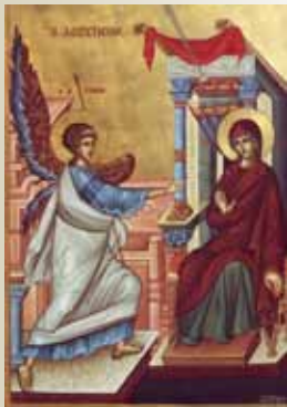
Buna Vestire (25 Martie)

“Cel ce ai sfințit pântecul Fecioarei cu nașterea Ta și mâinile lui Simeon le-ai bine- cuvântat, precum se cuvenea, întâmpinând și acum ne-ai mântuit pe noi, Hristoase, Dumnezeule. Pentru aceasta împacă lumea în războaie și întărește dreapta credință pe care ai iubit-o, unule Iubito- rule de oameni.”