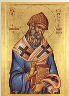
Sf. Ierarh Spiridon (12 decembrie)

“De dragostea lui Hristos fiind rănit, preasfințite, mintea înălțându-ți-se de lumina vie a Duhului, ai dobândit încercarea cea lucrătoare, prin adâncă-ți cugetare la cele înalte, Însuflăte de Dumnezeu, și jertfelnic dumnezeiesc făcându-te, cere pentru toți dumnezeiască iertare.”