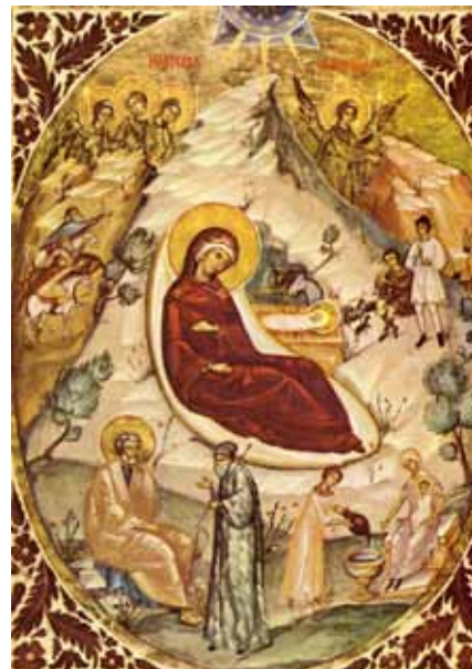
Nașterea Domnului Iisus Hristos

va veni la oameni Cel Ce împărătește peste toate făpturile. Și însuși voievodul lumii de atunci, mândrul potrivnic al lui Dumnezeu, diavolul, se văzu înșelat și nu îl recunoscă în Cel născut pe Acela pe Care îl pizmuise pe când încă era inger. Taina cea dinainte de veci, ascunsă puterii sale, despre mântuirea neamului omenesc putea fi cunoscută doar de cei care iau aminte la glasul din cer și într-acolo își îndreaptă privirile.