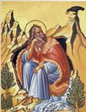
Sf. Prooroc Ilie Tesviteanul (20 iulie)

Tu, cel ce ai fost alesul Domnului pentru întoarcerea lui Israel de la închinarea către Baal, aspru muștrător al împăraților nelegiuți, strălucind cu văpaia râvnei pentru Dumnezeu atotțiitorul, cu sfințenia vieții și a minunilor, cel ce te-ai ridicat cu trupul la ceruri și vei veni înaintea celei de a doua veniri a lui Hristos, laudă îți aducem ție, profetule al lui Dumnezeu Ilie.[...]