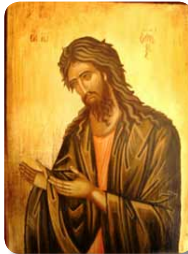
Sf Ioan Botezătorul

- Pentru că după botezul acesta avea să pună capăt legii vechi. Și deoarece pînă la vârsta de treizeci de ani omul poate săvârși toate păcatele, de aceea Hristos a rămas pînă la această vîrstă, ca să plinească toată legea, ca să nu spună nimeni că a desființat-o, pentru că n-a putut-o împlini. Nu ne asaltează toată viața aceleași patimi; în copilărie mai cu seamă naivitatea și zburdălnicia; în tinerețe plăcerea este mai puternică, iar după tinerețe vine și pofta de bani și de avere. De aceea Domnul a așteptat să treacă toate vîrstele, ca în toate să îplinească legea; și așa vine