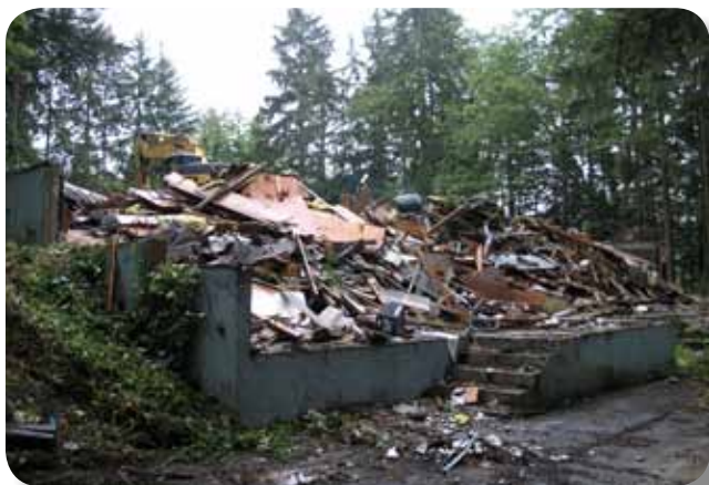
Mai multe poze puteți găsi pe site-ul nostru: www.ortodox.org

O decizie importantă în procesul de construcție a fost dacă trebuie să angajăm un General Contractor ca să coordoneze lucrarea sau să distribuim funcțiile unui GC la membrii din Building Committee. Noi hotărâsem deja în Consiliu să contractăm lucrările individual. În urma prezentării făcute pe 8 Mai de un general contractor ( Halverson ) și a unor opinii în BC pentru aceasta opțiune am decis să dedicăm ședința de miercuri 19 mai pentru re-analizarea acestei decizii. Pe scurt, valoarea de a avea un GC este că găsește subcontractori, alege cele mai bune biduri, încheie contractele, asigură plățile la subcontractori, creează planul de lucru și se ocupă de întreaga coordonare a activității pe șantier. În același timp GC își ia răspunderea legată de executarea contractelor pe lucrări și de terminarea întregului proiect în timp și în buget. O ofertă destul de impresionantă care ușurează munca celor din Building Committee și reduce riscul asociat cu execuția proiectului. Pe de altă parte, un GC adaugă un "mark-up" la întregul proiect, care în oferta de la Halverson era de 12.5% . Pentru proiectul nostru această opțiune ar fi însemnat o sumă de peste $300,000 adăugată la buget. Concluzia ședinței a fost că noi,