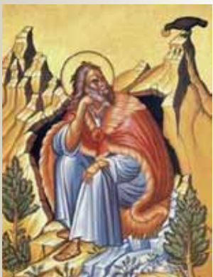
Sf. Prooroc Ilie Tesviteanul (20 iulie)

Tu, cel ce ai fost alesul Domnului pentru întoarcerea lui Israel de la închinarea către Baal, aspru muștrător al împăraților nelegiuți, strălucind cu văpaia râvnei pentru Dumnezeu atotțiitorul, cu sfințenia vieții și a minunilor, cel ce te-ai ridicat cu trupul la ceruri și vei veni înaintea celei de a doua veniri a lui Hristos, laudă îți aducem ție, profetule al lui Dumnezeu Ilie.[...]