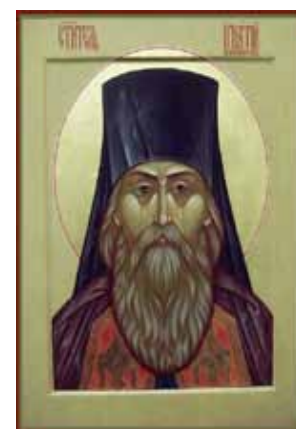
Sfântul Ignatie Briancianinov