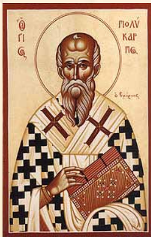
Sfântul Policarp, Episcopul Smirnei

“Și părtaş obiceiurilor și următor scaunelor Apostolilor fiind, lucrare ai aflat, de Dumnezeu insuflăte, spre suirea privirii la cele înalte. Pentru aceasta, cuvân- tul adevărului drept învățând și cu credință răbdând până la sânge, sfințite Mucenice Policarpe, roagă-te lui Hristos Dumnezeu să mântuiască sufletele noastre.”