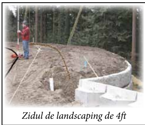
Zidul de landscaping de 4ft

Bugetul adițional pentru această lucrare a fost de $15,000. Opinia noastră, atât în Comitetul de Construcție cât și în Consiliu a fost că merită să facem această investiție ca să avem un spațiu mai mare pentru evenimente în aer liber, într-un loc plăcut, între Sala de Festivități și pădure. După aprobare, Tim a început imediat lucrarea respectivă care este acum terminată.