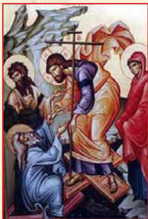
Icoana Învierii Domnului

Hristos a Înviat din morți Cu moartea pe moarte călând Și celor din mormânturi Viață dăruindu-le.