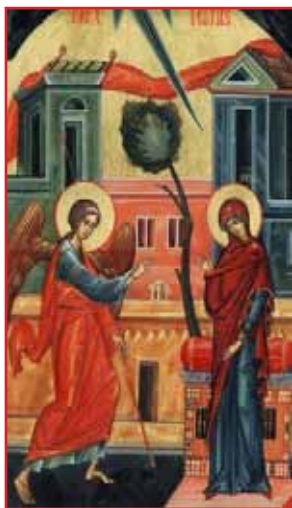
Icoana Bunei Vestiri

“Căci, de îndată ce a văzut-o pe Maica lui Dumnezeu grăbind către mormânt – el, care odinioară îi grăise: “Nu te teme, Marie, căci ai aflat har la Dumnezeu” [Luca 1, 30] – se grăbește [la rându-i] să coboare și în aceea zi, ca să-i grăiască din nou aceleași cuvinte celei de-a pururea Fecioare, vestindu-i învierea din morți a Celui Născut din ea fără de sămânță, să ridice piatra și să arate mormântul gol și giulgiul, întărind astfel, pentru ea, vestea cea bună.” Sf Grigorie Palama