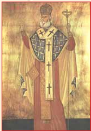
Sfântul Ierarh Martir Antim Ivireanul

“Sfinte Părinte Ierarhe Antim, după vrednicie ai fost rânduit păstor și învățător al turmei celei cuvântătoare și cu înțelepciune dumnezeiască revărsând râurile sfintelor tale cuvinte, viața ți-ai pus-o pentru păstoriții tăi și cununa muceniciei ai dobandit de la Hristos Dumnezeu - pe care roagă-L, să dăruiască pace și mare mila celor ce săvâresc sfânta pomenirea ta.”