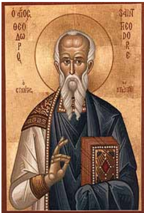
Sfântul Teodor Studitul

Triodul este cunoscut atât ca o carte de cult, cât și ca o perioadă liturgică a anului bisericesc. Etimologic, cuvântul triod provine din grecescul triodion, τριώδιον, format din cuvintele "tria" (τρια), trei, și "odi" (ὠδή), odă, adică cântare în trei ode / strofe. Practic, în viața liturgică, Triodul are două sensuri: