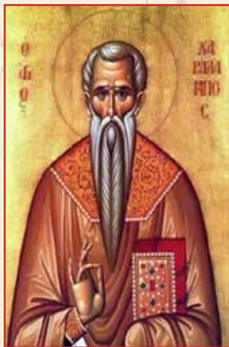
Sfântul Sfințitul Mucenic Haralambie

"Arătat-te-ai înțelepte Haralambie ca un stâlp nemișcat Bisericii lui Hristos și sfeșnic lumii pururea luminos strălucit-ai în lume prin mucenicie înțelepte și ai risipit întunecarea idolilor. Drept aceea roagă-te lui Hristos cu îndrăzneală ca să ne mântuim.."