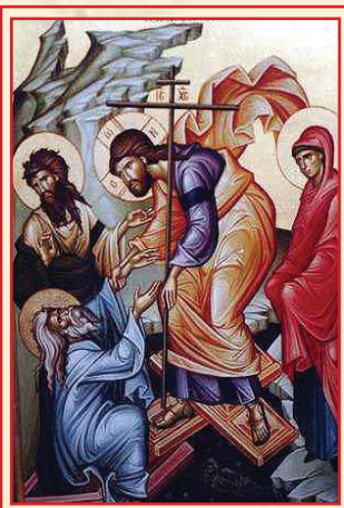
Icoana Invierii Domnului nostru Iisus Hristos

Hristos a Înviat din morți Cu moartea pe moarte călcând Și celor din mormânturi Viață dăruindu-le.