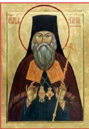
Sfântul Ignatie Briancianinov

Trecerea Cuviosului în rândul sfinților s-a petrecut pe data de 29 iunie 1992, hotărându-se ca data sa de prăznuire anuală să fie 30 iunie.