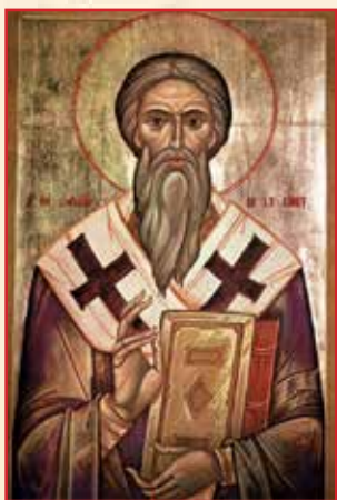
Sfântul Ierarh Ghelasie de la Râmeț

"De Dumnezeu purtătorule, Părintele nostru Ghelasie, povătuitorul călugărilor, preoților și credincioșilor, podoaba cuvioșilor și lauda arhierilor, sprijinitorul celor în necazuri și făcătorule de minuni, cu nevoințele tale chip de sfințenie te-ai arătat, iar acum cu îngerii în ceruri te veselești. Cu aceștia roagă-L pe milostivul Dumnezeu să ne dăruiască nouă pace și mare milă."