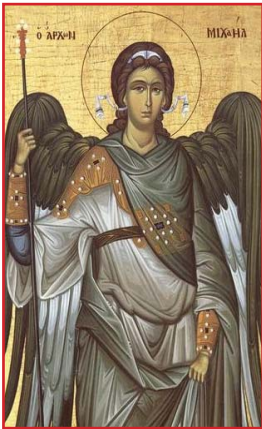
Sfântul Arhangel Mihail

"Mihail, ce se tâlcuiește "puterea lui Dumnezeu", este voievodul oștilor cerești și cel dintâi din ceata Sfinților Arhangheli.