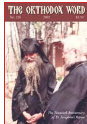
Orthodox Word #226 Sept-Oct 2002 20 de ani de la trecerea la Domnul a Parintelui Serafim Rose

Puteti citi textul integral al conferinței la adresa: http://saraca.orthodoxphotos.com/biblioteca/perspectiva_ortodoxa.htm