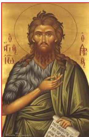
Icoana Sfântului Ioan Botezătorul și înaintemergătorul

"Iubiților mei frați, dacă trebuie să cinstim pe Maica Domnului, care-i mai presus și decât Ioan Botezătorul, că L-a născut pe Hristos cu trup, apoi al doilea după dânsa trebuie să-L cinstim pe Sfântul Ioan Botezătorul. Deci să nu fie casă de creștini unde să nu fie icoana Sfântului Ioan Botezătorul și unde să nu vă rugați acestui mare proroc și înger în trup și înaintestătător al tuturor cetelor dreptilor, cum îl numește Biserica" Părintele Cleopa