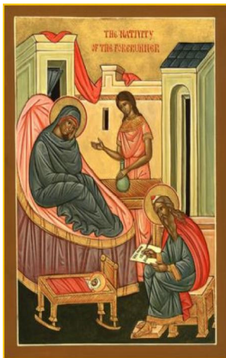
Nașterea Sfântului Ioan Botezătorul

“Ceea ce mai înainte era stearpă, astăzi pe Înaintemergătorul lui Hristos naște și el este plinirea a toată proorocia. Că pe Care proorocia mai înainte L-au propovăduit, pe Acesta în Iordan mâna punându-și, s-a arătat Cuvântului lui Dumnezeu, Prooroc Propovăduitor, împreună și Înaintemergător.”