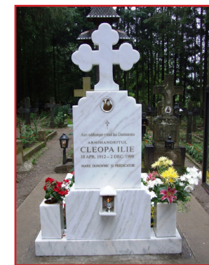
Mormântul Părintelui Cleopa de la Mănăstirea Sihăstria

"Pentru mântuire sunt necesare trei lucruri.