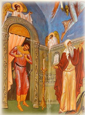
Duminica vameșului și a fariseului

La mulțimea păcatelor mele celor rele, cugetând eu, ticălosul, mă cutremur de înfricoșata zi a judecății, ci îndrăznind spre mila milostivirii Tale, ca David strig Ție: Miluiește-mă Dumnezeule după mare mila Ta!