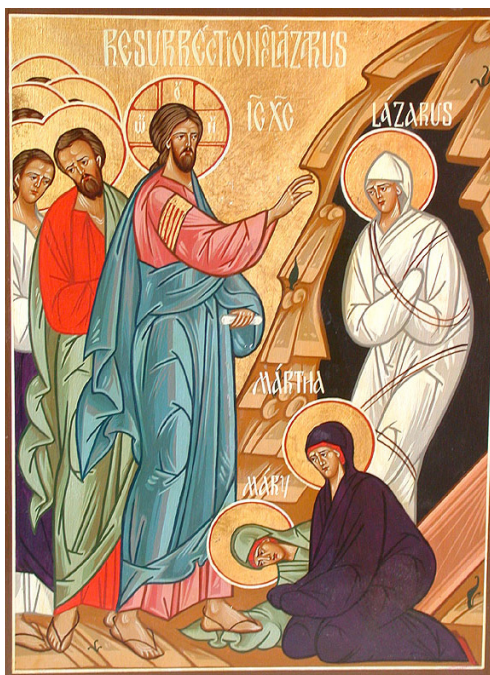
Învierea lui Lazăr

mai întâi a împărăției lui Dumnezeu și a dreptății Sale”. Pr. Schmemmann spunea despre această revenire la viața lumescă: „Cu adevărat, trăim ca și când El n-ar fi venit nicio-